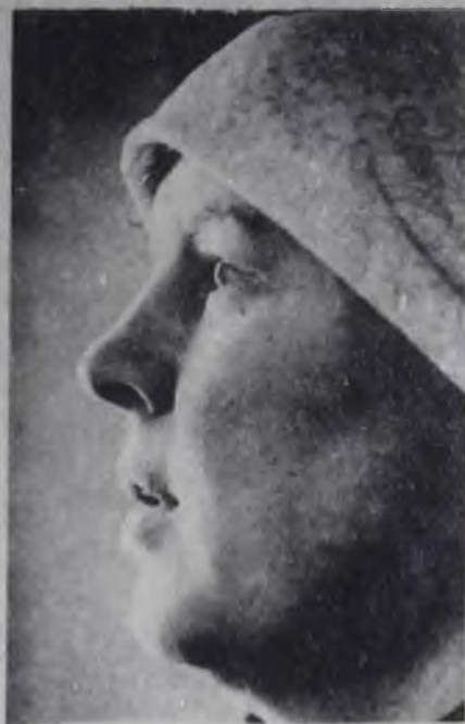
— 6 —