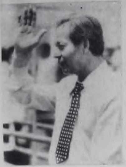
груши и яблоки. А можно сократить путь и пройти лесной тропкой, вдохнуть целебный воздух, полюбоваться шедрыми дарами природы. В насыщенных тесной программой туристских днях эти небольшие