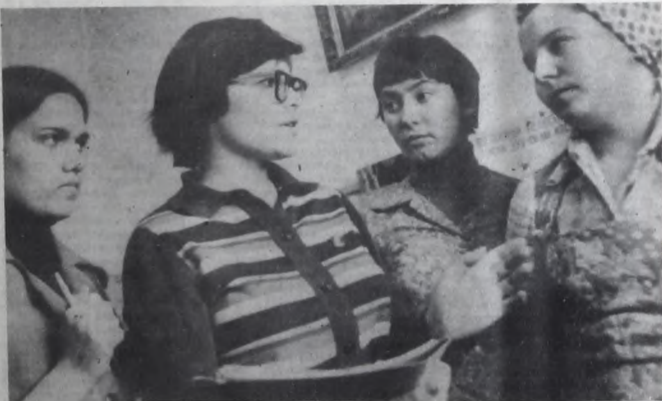
В КОМСОМЛЬСКОЙ организации швейной фабрики состоит более 300 человек. Вечера отдыха, диспуты, клубы по интересам, кинолектории, устные журналы — все эти мероприятия объединяют молодежь. Вот и сейчас собрались активисты в комитете комсо-

молд и обсуждают сценарий второго заседания клуба «Анечка».