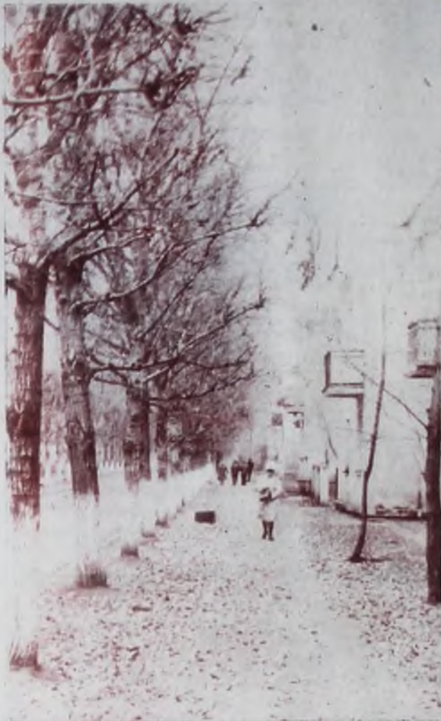
Осенний мотив.