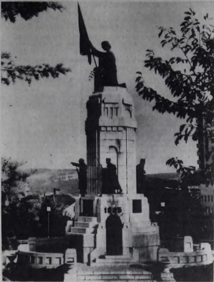
• МЫ — ИНТЕРНАЦИОНАЛИСТЫ