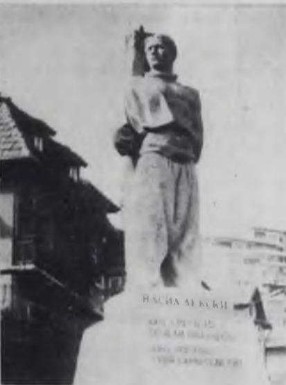
РОЗЫ И ВИНОГРАД

М ИМО ОКОН автобуса резными рядами каштаны, раскидистый орешник, тополя, яблоневые деревья, а за их строем — бесконечные поля, синеющие с прэвой стороны горы. Мы въезжаем в Казанлыкскую долину. По амфитеатру предгорий изгибается широкая лента шоссе, ведущего к Шилке. Поднимаясь сюда, к Шилкинскому перевалу, оглядываешься на долину, которая издревле славится розами. Знаменитое розовое масло, идущее в парфюмерию многих стран мира, — именно отсюда, из этой долины.