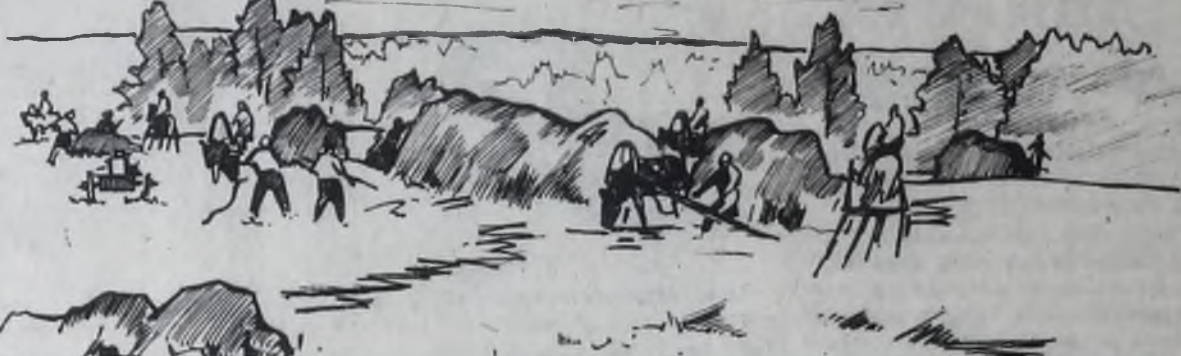
Рисунки Н. КОЗЬМИНА.

Жмурит от света свои незабудки — Явно довольна собой! В образе таты на помощь Полдень спешит голубой. С детства, мой друг, на Родину мы познаем, Где до озноба настоян на Каждый лесной водоём. С детства, мой друг, на К амшей стремимся любви, К той, что бурлит родниками В песенной нашей кровли.