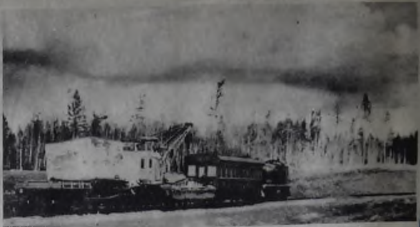
НА БАМОВСКОМ НАПРАВЛЕНИИ

ЮЖНО-ЯКУТСКИЙ РАЙОН получил интенсивное развитие с от-