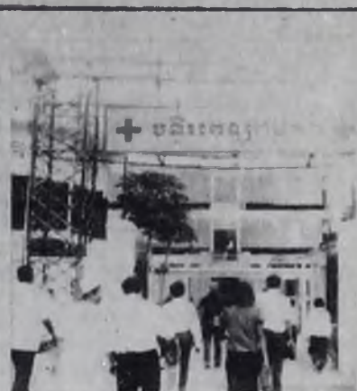
Фото И. АМОСОВА.

Народная Республика Кампучия заживает раны, нанесенные полпотовскими реакционерами и пекинскими экспансионистами. В Пномпене уже работают ТЭЦ, текстильный комбинат, каучуковое предприятие, механические мастерские. Девять госпиталей и клиник принимают больных, в школы — учащихся. На снимке: госпиталь имени 7 января в Пномпене. Фотохроника ТАСС.