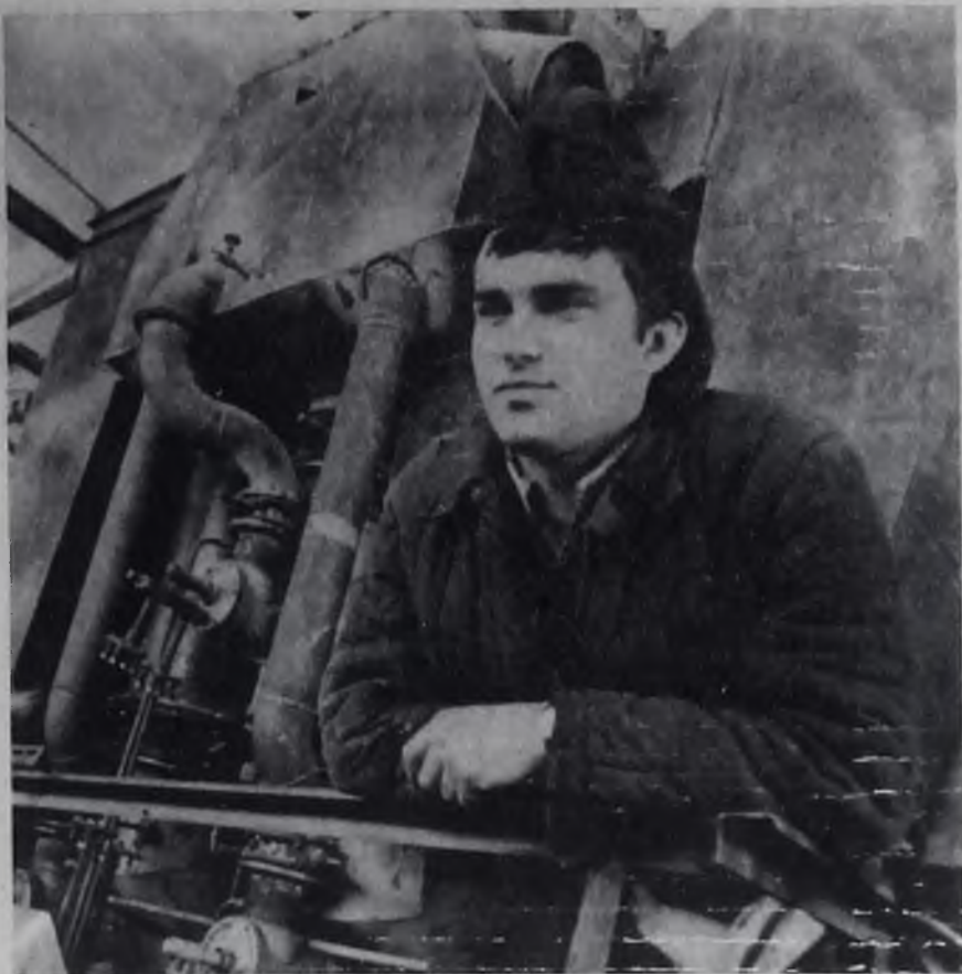
СООБЩАЕТ КОРПУНКТ ГАЗЕТЫ НА ЗАВОДЕ БВК