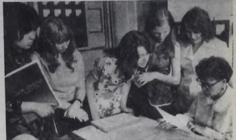
Идут экзамены в политехническом техникуме.