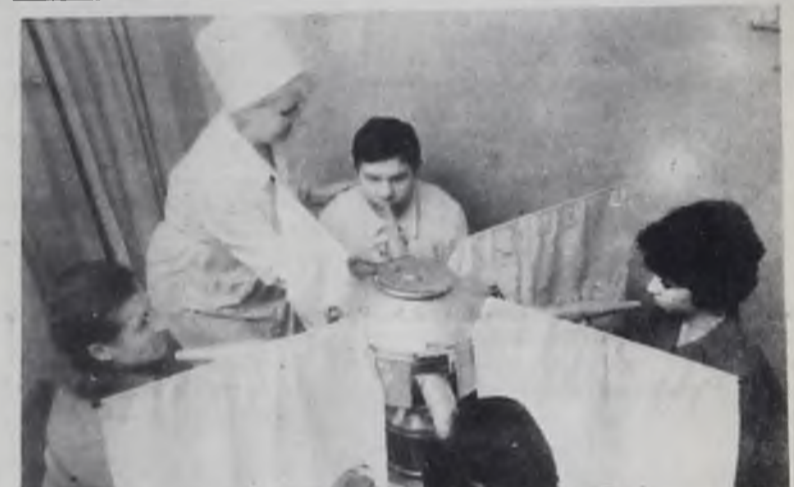
В профилактории нефтехимиков.