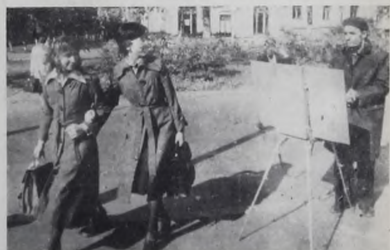
Будет картина о любимом городе.