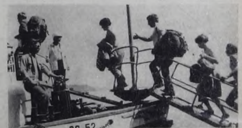
Туристы на Байкале.