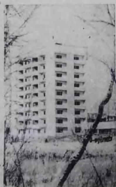
Ангарск, 15-й микрорайон.

Это будут минеральные удобрения, цемент, бензин, строительные материалы, пиломатериалы, электроприборы и другая продукция, необходимая для народного хозяйства первого в мире социалистического государства.