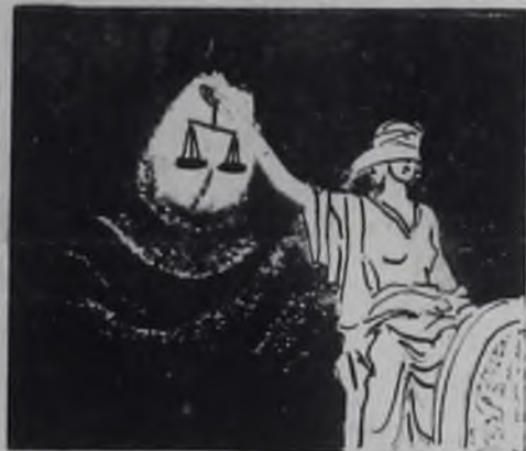
◆ Американская Фемида.

Процессы над борцами за гражданские права в США показали, что американская судебная система пронизана расизмом. (Из газет).