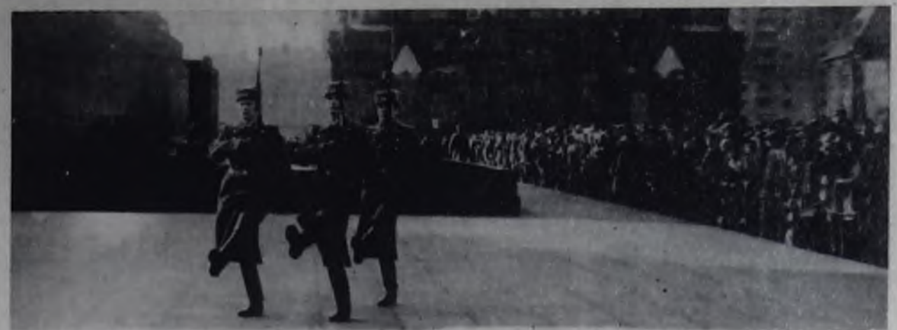
«ФОТООБЪЕКТИВ-79» „ПОСТ НОМЕР ОДИН“