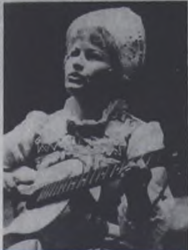
ЧТО, ГДЕ, КОГДА?

В ДК «Современник» состоялся большой концерт хоровой песни. Лучшие коллективы художественной самодеятельности города принимали участие в концерте. Большой успех выпал на женский вокальный ансамбль медицинских работников «Надежда», хор русской песни ДК «Сов-