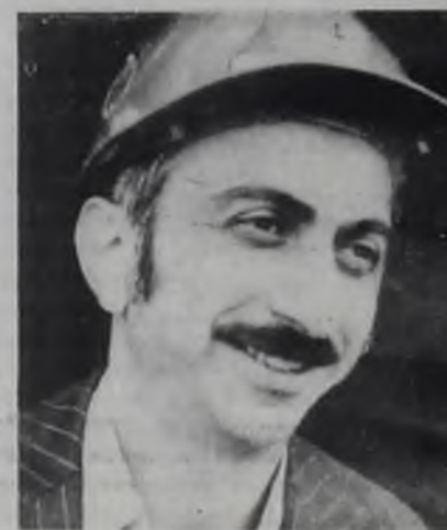
(ЛДКК). «Моральное и материальное стимулирование за качество» и другие.