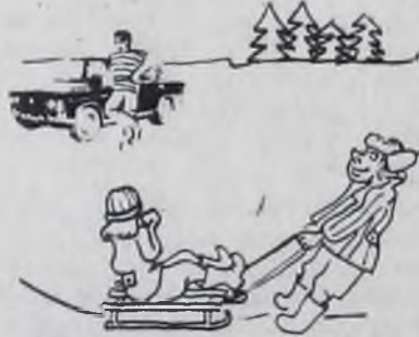
— Ах, мамочка, на саночках каталась я не с тем...