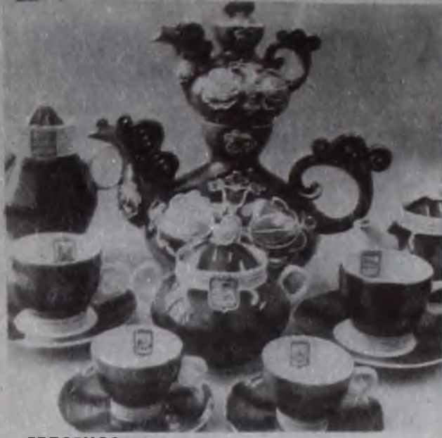
БЕЛУРУССКАЯ ССР. Чайные сервизы, тарелки, масленки, салатницы, вазы для цветов и фруктов, много другой посуды изготовляет Минский фарфоровый завод. В нынешнем году предприятие выпустит почти 6 миллионов фарфоровых изделий.

На заводе проводится реконструкция ряда цехов и участков. С ее завершением предприятие сможет удвоить выпуск посуды массового спроса.