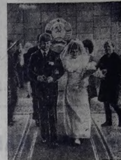
В городе — свадьбы...