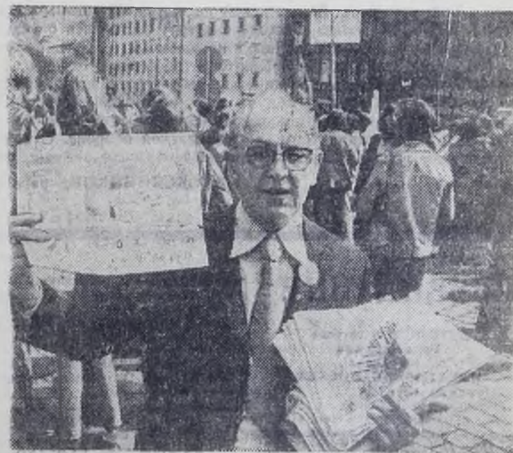
ФРГ. На улице Франкфурта-на-Майне продается очередной номер еженедельника «Ди тат».

В этом году демократическая общественность страны отметила 25-летие этой газеты, которая является печатным органом крупнейшей организации — Объединение лиц, преследовавшихся при нацизме, — Союза антифашистов. Постоянно растет круг читателей «Ди тат», разоблачающей все проявления неонацизма, реваншизма и реакции, выступающей за прочный мир, международную безопасность и сотрудничество.