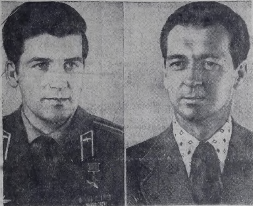
На снимках: командир космического корабля «Союз-18» летчик-космонавт СССР, Герой Советского Союза Петр Ильич Климук. Бортинженер

Космонавты проводили эксперименты по лазерной локализации станции «Салют-4» с целью отработки лазерных систем измерения дальности и слежения за космическими аппаратами. Посланные с Земли лазерные импульсы отражались от установленного на станции оптического углового отражателя, а затем регистрировались наземной приемной аппаратурой. В ходе экспериментов зарегистрированы четкие отраженные сигналы.