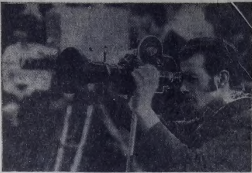
«ОБЪЕКТИВ-73», ● Первый снег.