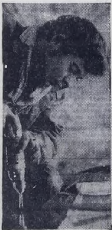
Ангарский завод монтажных заготовок треста Сибхиммонтаж выполняет заказы для

многих строящихся промышленных предприятий Сибири и Дальнего Востока. Ачинский глиноземный, Братский лесопромышленный комплекс, Ангарский нефтеперерабатывающий и другие — вот адреса заказчиков этого предприятия.