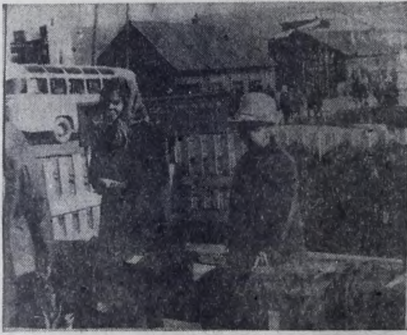
Выставка-продажа Ангарской фабрики индпошива.