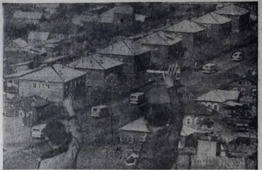
На улицах Бохана.