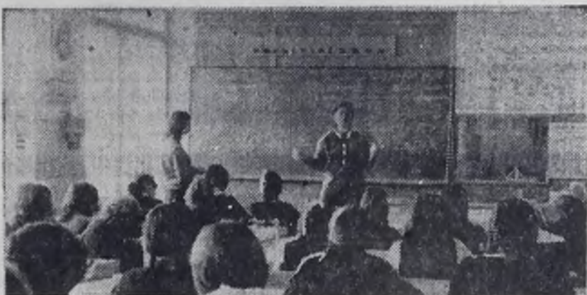
В 10-м микрорайоне в средней школе № 40 начался второй учебный год. Более 1000 ребят из 9-го и 10-го микрорайонов обучаются здесь. В школе оборудованы кабинеты, мастерские, есть спортивный зал, столовая.