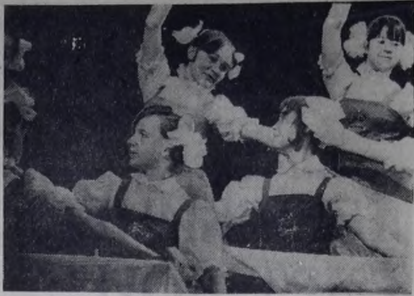
В ансамбле танца «Школьные годы» ДК нефтехимиков эти дни насыщены репетициями. Идет подготовка к выступлению с концертной программой в подшефном Боханском районе с 14 по 16 сентября.

дений, организаций, учебных заведений, секретарей партийных и комсомольских комитетов, профсоюзные организации оказать музею всемерную помощь в организации фондов. Им предложено безвозмездно передать для экспонирования материалы по истории развития города и его предприятий, организаций, учреждений. На стендах музея появятся образцы продукции, различные модели, документы, показывающие развитие в Ангарске промышленности, строительства, науки, культуры и т. д. Большое внимание будет уделено материалам, рассказывающим об ангарчанах — участниках гражданской и Великой Отечественной войн, Героях Советского Союза и Героях Социалистического Труда, ветеранах производства, передовиках и почетных гражданах города.