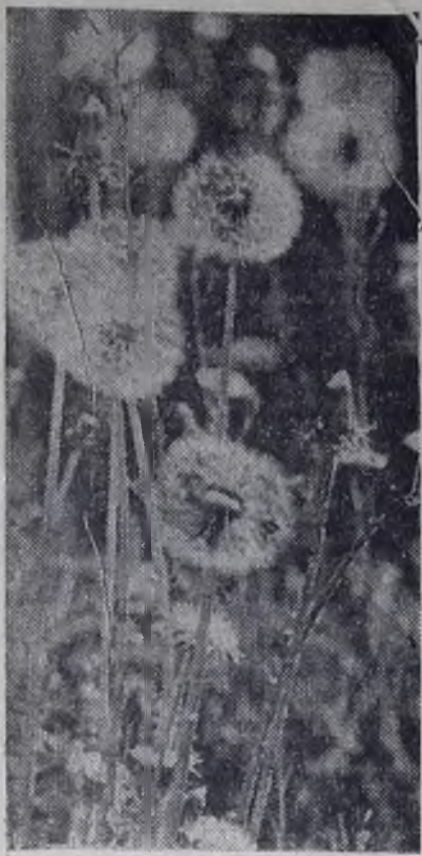
На лесной поляне.