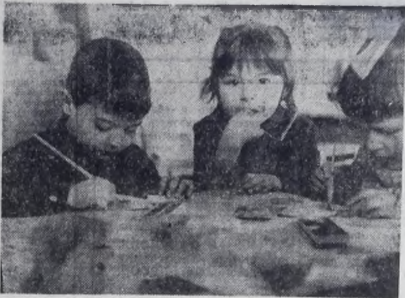
В детском саду.