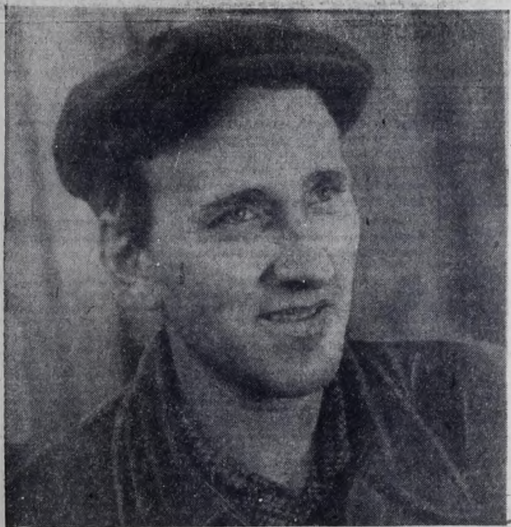
ГВАРДЕЙЦЫ ТРЕТЬЕГО, РЕШАЮЩЕГО

Весна ставит большие задачи перед земледельцами, и успешное решение их во многом зависит от совершенствования шефской помощи предприятий селу.