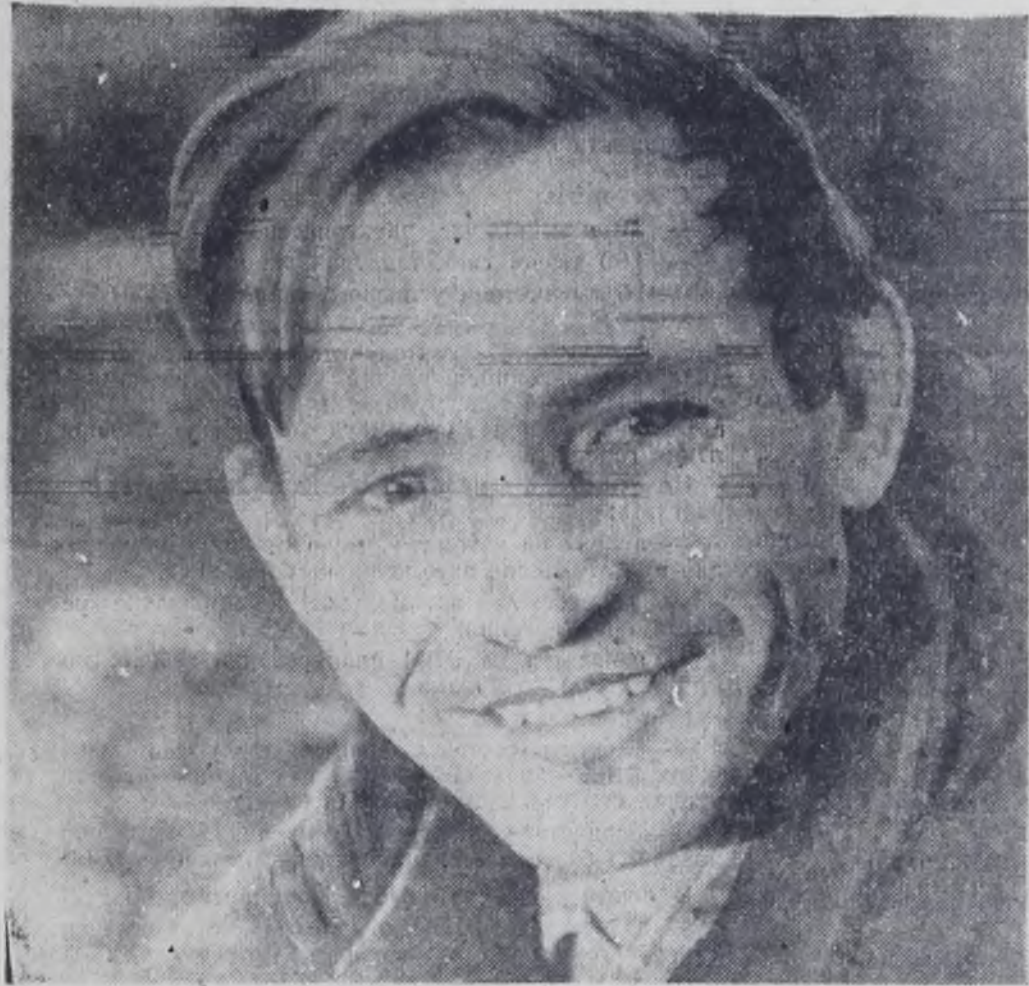
Корпункт на пусковом: БВК

(Сегодня мы публикуем обязательства городов Братска и Ангарска на 1973 год).