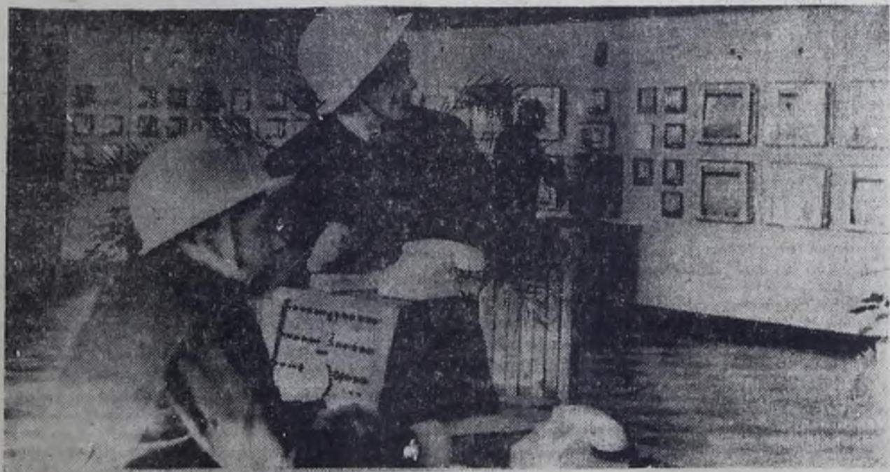
Коллектив установки 35/6 Ангарского нефтеперерабатывающего завода борется за звание коллектива коммунистического труда. Уже сейчас все четыре смены носят это высокое звание. Успешно начала нефтепереработчик третий год пе-