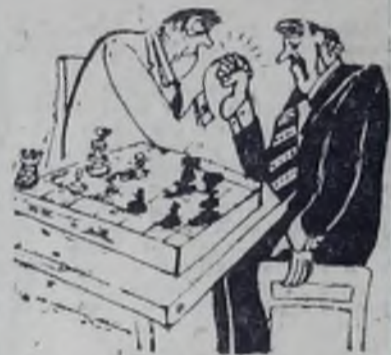
ПРИГЛАШЕНИЕ К УЛЫБКЕ