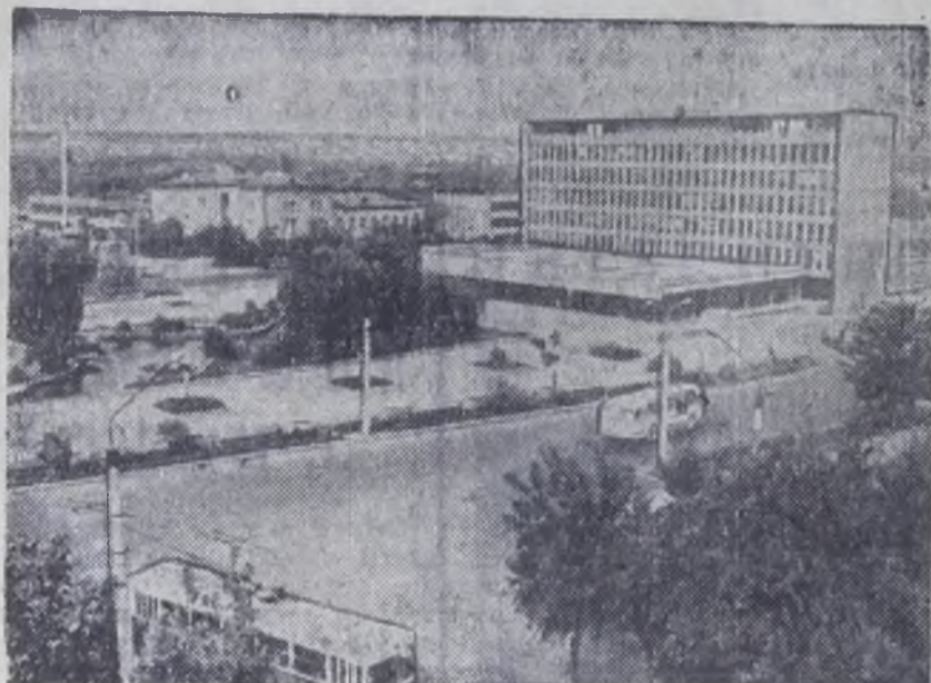
Столица Туркменской ССР — Ашхабад. Площадь имени Карла Маркса. На переднем плане — новое семиэтажное здание управления «Каракумстрой».

(Из Постановления ЦК КПСС «О подготовке к 50-летию образования СССР»).