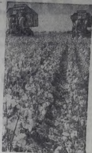
Массовую уборку хлопка ведут механизаторы совхоза «Теджен» Марыйской области. Хлопкоробы решили завершить уборочную страду к 55-летию Великого Октября и дать стране 8200 тонн сырца.

На снимке: уборка хлопка.