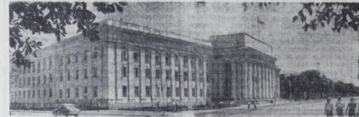
Столица Киргизской ССР — город Фрунзе. Центральная площадь.

Наш комбинат — это комбинат дружбы. Первый кирпич в его основание положили русские специалисты цветной металлургии. Опытные мастера из России, с Украины и из других братских республик помогали осваивать новейшее оборудование.