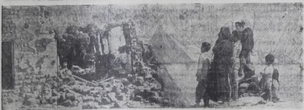
Израильские военные власти с ожесточением продолжают насилие и прямой террор в отношении коренного арабского населения оккупированной территории: разрушают дома, изгоняют из родных мест, на отнятой земле создают израильские поселения и военные лагеря. Арабов переселяют в палаточные лагеря.