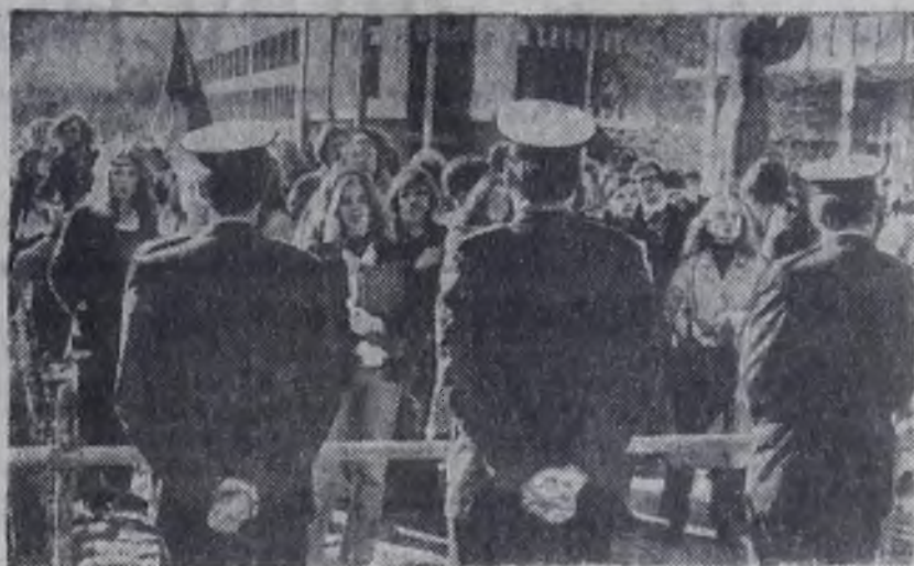
Молодежь Австралии решительно выступает против участия страны в агрессивном блоке СЕАТО.