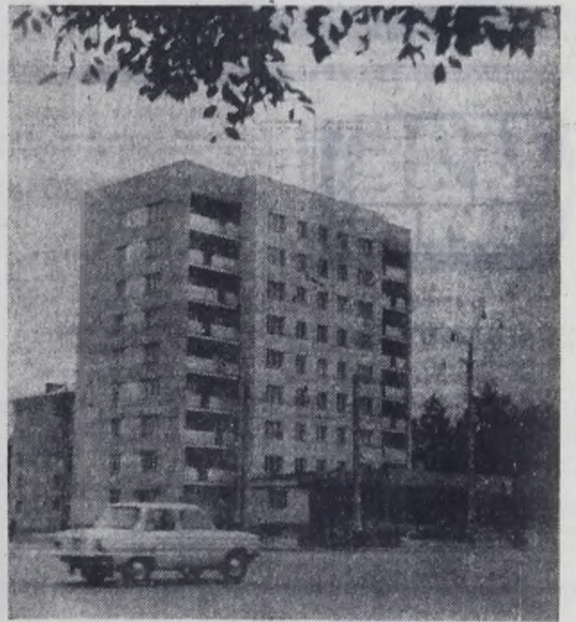
Ангарск. Дом на улице Чайковского. Здесь на первом этаже скоро откроется большой книжный магазин.