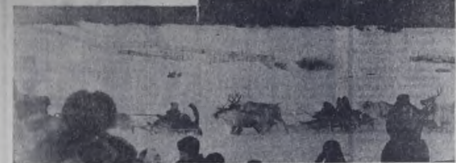
Интересные состязания — гонки на оленях.

Вечером праздник перенесся в районный Дом культуры. Здесь с трибуны зву-