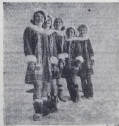
Вокальный ансамбль «Северянка».