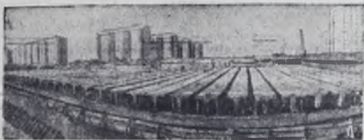
Набережные Челны (Татарская АССР). 50-тысячная армия строителей — посланцев 30 областей страны, представителей 40 национальностей всех союзных республик, — сооружает на Каме гигантский автозавод. 130 тысяч дизельных автомобилей в год и автопоездов большой грузоподъемности будет выпускать КАМАЗ. Уже в этом году вступит в строй первый камского автозавода — ремонтно-инструментальный завод. На снимке: отсюда начинается кольцевой проезд. На переднем плане — строительство транспортного тоннеля.