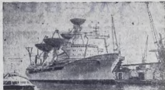
Из порта приписки — Одессы ушло в плавание построенное ленинградскими судостроителями новое научно-исследовательское судно Академии наук СССР «Космонавт Юрий Гагарин».

С опережением графика строительно-монтажных работ трудятся и весь коллектив управления. План первого года пятилетки он намерен завершить к 25 декабря.