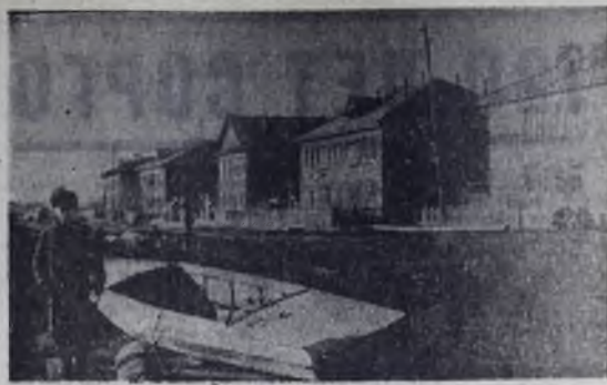
Поселок судостроителей. Новая улица.