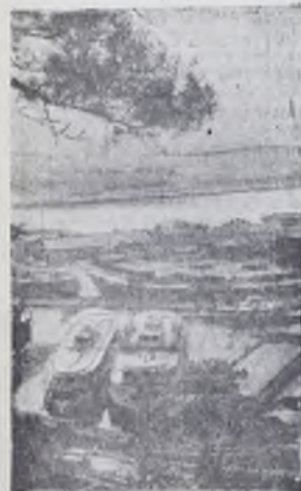
Иркутск с птичьего полета.

ры, горы и тайга. Очутись сейчас в одиночестве там, внизу, — твой голос никто не услышит. Лишь когда самолет, словно зацепившись крылом за голубую ленту, следует точно по руслу Лены-реки, набором игрушек мелькают кое-где поселения, прижавшиеся почти к самой воде.