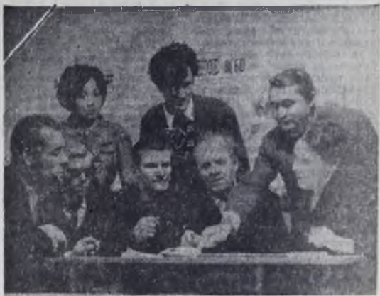
Артисты народного театра Киренска обсуждают новую пьесу. В прошлом году этот театр завоевал первое место в области.