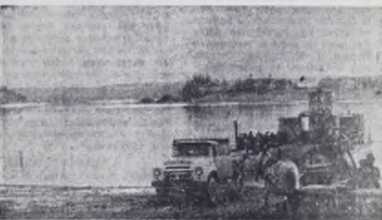
Тругая-паром. Каждые полчаса—туда, каждые полчаса—оттуда.