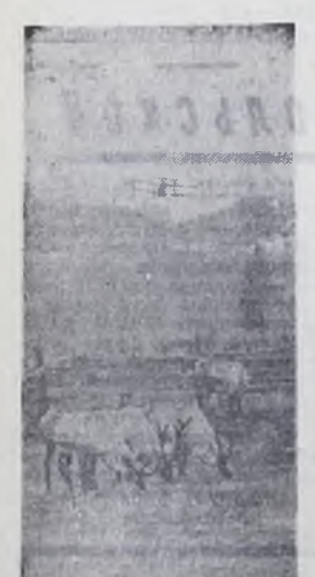
Олени во дворе — верный при-знак дальней дороги.