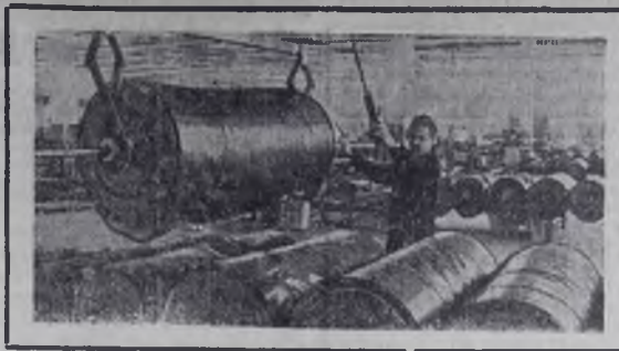
БАШКИРСКАЯ АССР, город Нефтекамск. Вступила в строй вторая очередь завода искусственных кож «Сима». Продукция предприятия — искусственная кожа из полихлорвиниловой смолы на тканевой и трикотажной основе — поставляется главным образом в автомобильную промышленность. На новом производстве освоены также выпуск одежды искусственной кожи, из которой можно шить куртки, пальто. Пущена в действие машина по изготовлению клеенки для ширпотреба. На снимке: отгрузка готовой продукции предприятием.