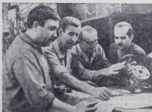
Советское машиностроение достигло крупных успехов. В девятой пятилетке оно получит дальнейшее развитие. Будет введено в строй много новых заводов, среди них комплекс предприятий по производству тракторов Т-150 в Харькове, заводы станков-автоматов в Житомире, автоматических линий в Барзновичах, комплекс заводов по выпуску грузовых автомобилей в Татарской АССР и другие. Значительно

А в сентябре из подшефных районов в управление приходят тревожные вестки. Длительные дожди превратили полевые дороги в непреодолимые препятствия для автомашин. Кое-где даже комбайны встали. Вынужденные просто — тяжелое испытание для автомобилистов. Но страда продолжается. Впереди октябрь — последний этап уборки урожая.