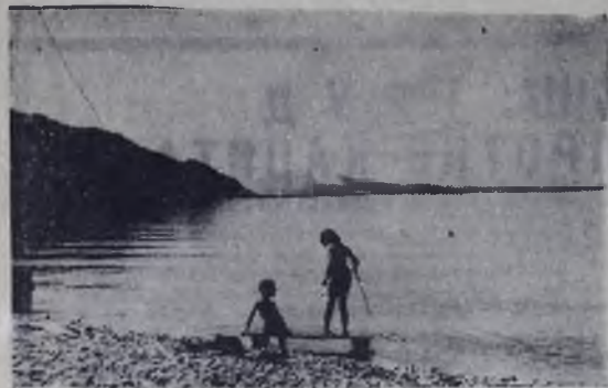
«Объектив-71», У священного моря.