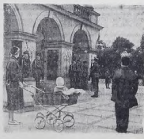
Варшава. Могила Неизвестного солдата на площади Победы. Смена почетного караула.

Даже эти немногочисленные примеры убедительно свидетельствуют о целесообразности и плодотворности непосредственного взаимодействия обеих стран в области техники. Комитеты по делам науки и техники ПНР и ССР как одну из важнейших проблем рассматривают возможность повышения эффективности научных и технических исследований.