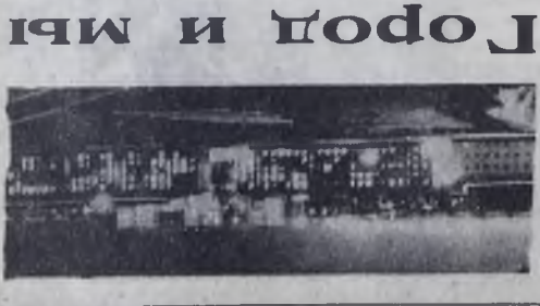
Группа житейцев 94-го квартала. Будет продолжаться...