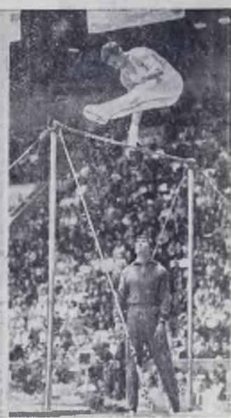
МАТЕРИАЛЫ, ПОСВЯЩЕННЫЕ ВСЕСОЮЗНОМУ ДНЮ ФИЗКУЛЬТУРНИКА, ЧИТАЙТЕ НА 4-Й СТРАНИЦЕ.