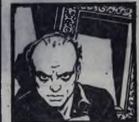
Возвращение Святого Луки