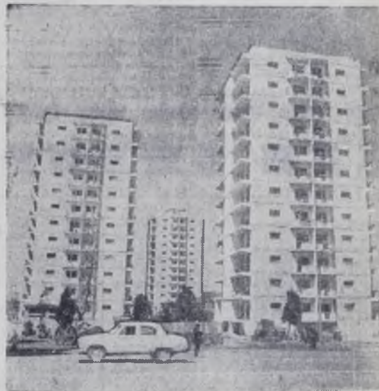
Столица Аджарии Батуми — один из красивейших городов Черноморского побережья. Здесь ведется большое жилищное, культурно-бытовое и промышленное строительство.

16 ИЮЛЯ 1971 ГОДА ИСПОЛНЯЕТСЯ 50 ЛЕТ АДЖАРСКОЙ АССР