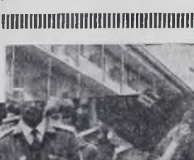
Снимок: корпуса нового санатория «50 лет Октября».