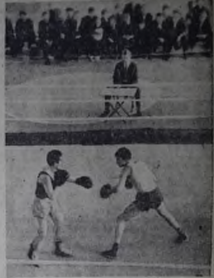
«ОБЪЕКТИВ-71» ИДЕТ БОЙ.

В планах социального развития советского общества на предстоящее пятилетие центральное место занимают вопросы охраны здоровья народа, повышения его общеобразовательного уровня, улучшения организации отдыха трудящихся, культуры. Вот почему мы стремимся сделать туризм — как «плавильный», так и самостоятельный, — истинно массовым, доступным для каждого советского человека.