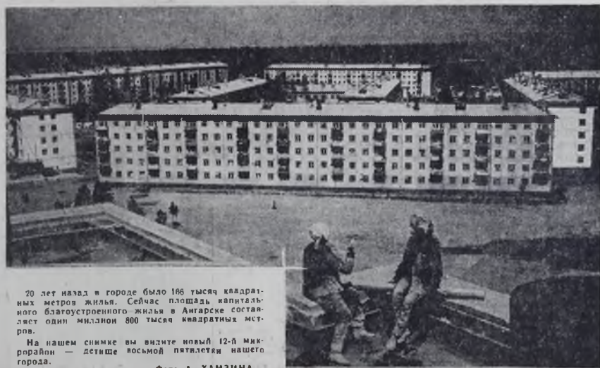
20 лет назад в городе было 186 тысяч квадратных метров жилья. Сейчас площадь капитального благоустроенного жилья в Ангарске составляет один миллион 800 тысяч квадратных метров.