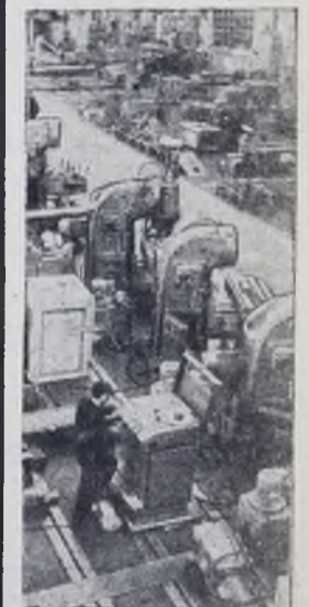
Горьковский завод фрезерных станков выпускает высокопроизводительные агрегаты с программным управлением. За процессом обработки детали следит автомат. Конфигурация будущей детали записывается на пленку. Станок выполняет команду автомата и поддерживает заданный режим обработки.

На снимке: участок сборки станков с программным управлением.