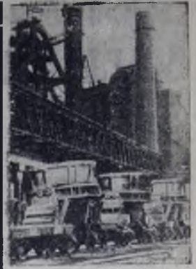
Челябинская область. За большие успехи в выполнении заданий пятилетнего плана и повышение эффективности производства Указом Президиума Верховного Совета СССР коллектив Магнитогорского металлургического комбината имени В. И. Ленина награжден вторым орденом Ленина.

За высокие производственные показатели в соревновании в честь XXIV съезда присвоено звание «Лучший цех Ангарского ордена Трудового Красного Знамени нефтехимического комбината» девяти цехам, в том числе центральной заводской лаборатории завода полукислородной лаборатории завода гидрирования, кузнечно-термическому цеху РМЗ и другим. Десяти сменам, службам и участкам присвоено звание «Лучший коллектив нефтехимического комбината». Более 150 нефтехимиков, наиболее отличившихся при выполнении социалистических обязательств, награждены премиями, Почетными грамотами и ценными подарками.