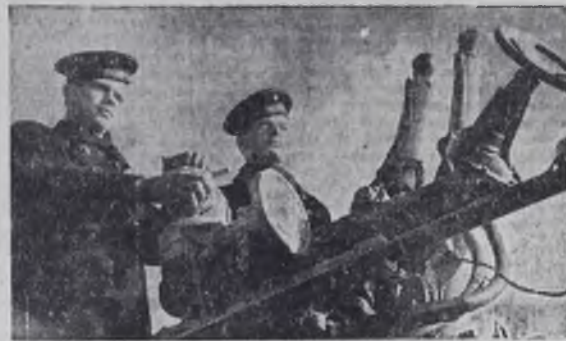
Краснознаменный Тихоокеанский флот. На крейсере «Александр Суворов» зенитчики готовы к открытию огня.

В. ШИКАРЕНКО, старшина I статьи. Краснознаменный Тихоокеанский флот.